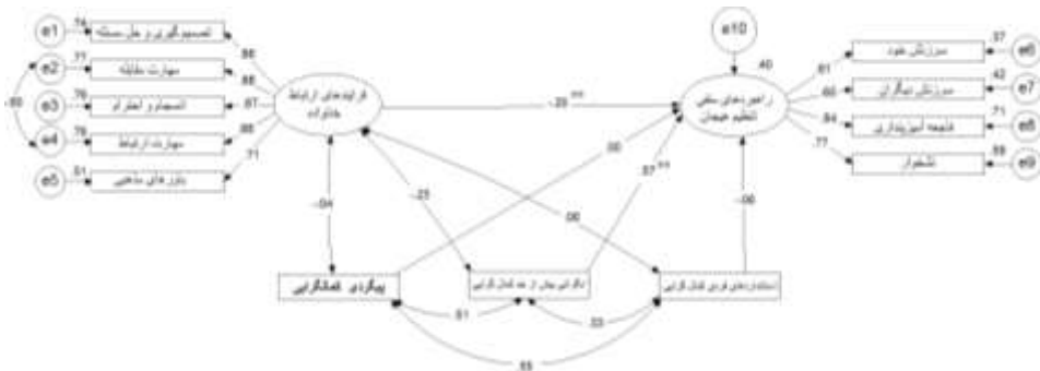
شکل ۲. الگوهای ساختاری پژوهش در تبیین رابطه ابعاد کمال‌گرایی و فرایند ارتباطی خانواده بر راهبردهای منفی تنظیم هیجان

در شکل ۱، مجذور همبستگی‌های چندگانه برای راهبردهای مثبت تنظیم هیجان برابر با ۰/۳۱ است، که نشان می‌دهد ۳۱ درصد از واریانس راهبردهای مثبت تنظیم هیجان تغییرها در نمره‌های فرایند ارتباط خانواده و ابعاد کمال‌گرایی تبیین می‌کند.